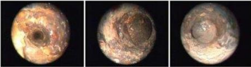
Dokumentation: Reinigung eines Kühlkanals.